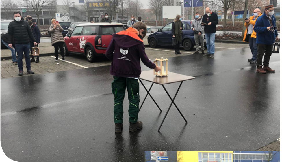
Übergabe des Lichts auf dem IKEA-Parkplatz