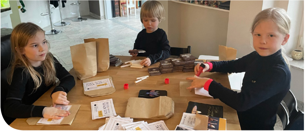
Packen der Tüten