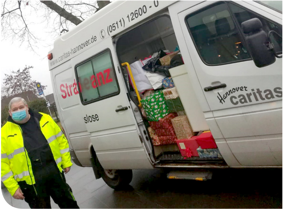
Der Bus der Straßenambulanz der Caritas beim Abholen der Geschenke.