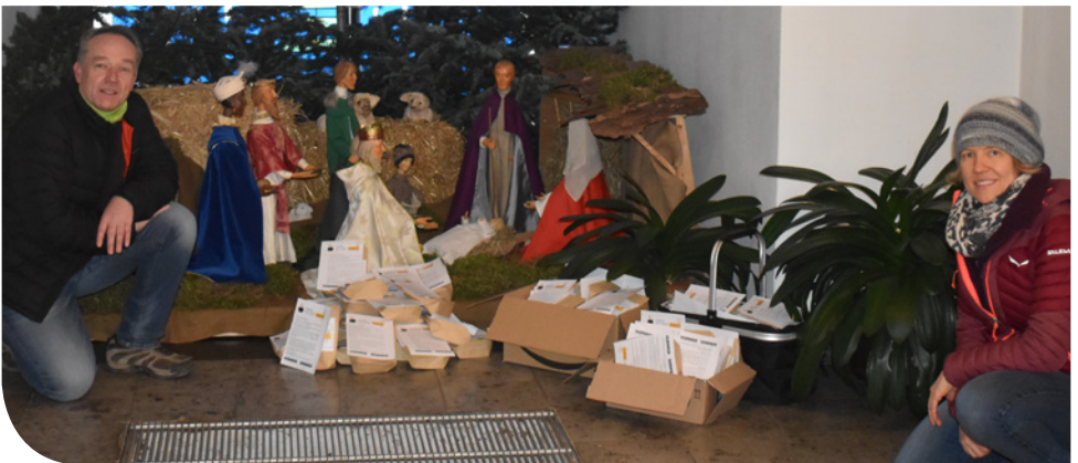
Segnung in der Kirche