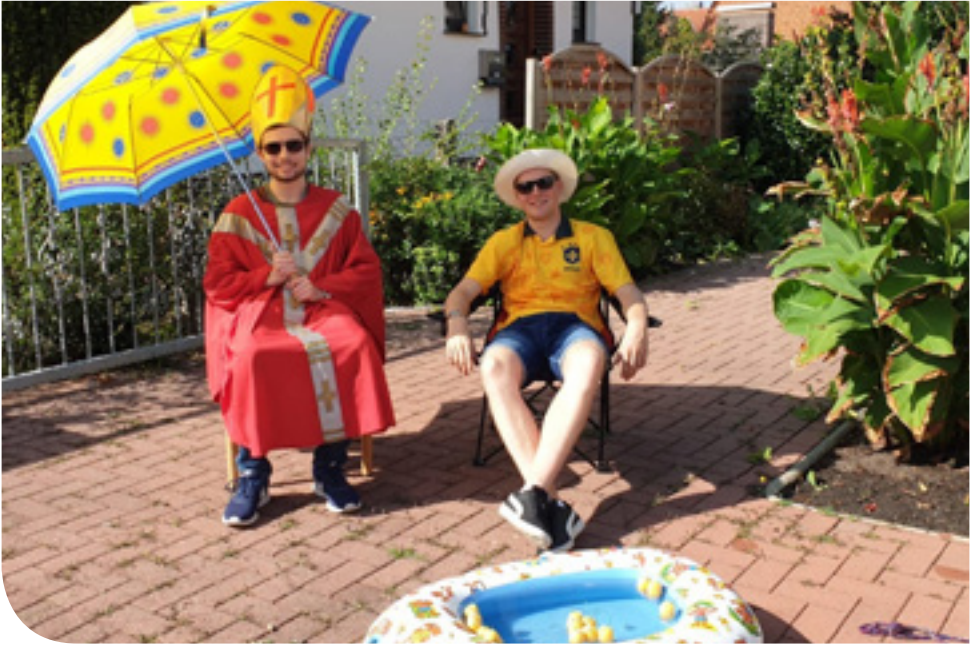
Beweisfoto: Der Nikolaus (links) konnte gerade noch rechtzeitig mit Sonnenschirm und Erfrischungsgetränken versorgt werden