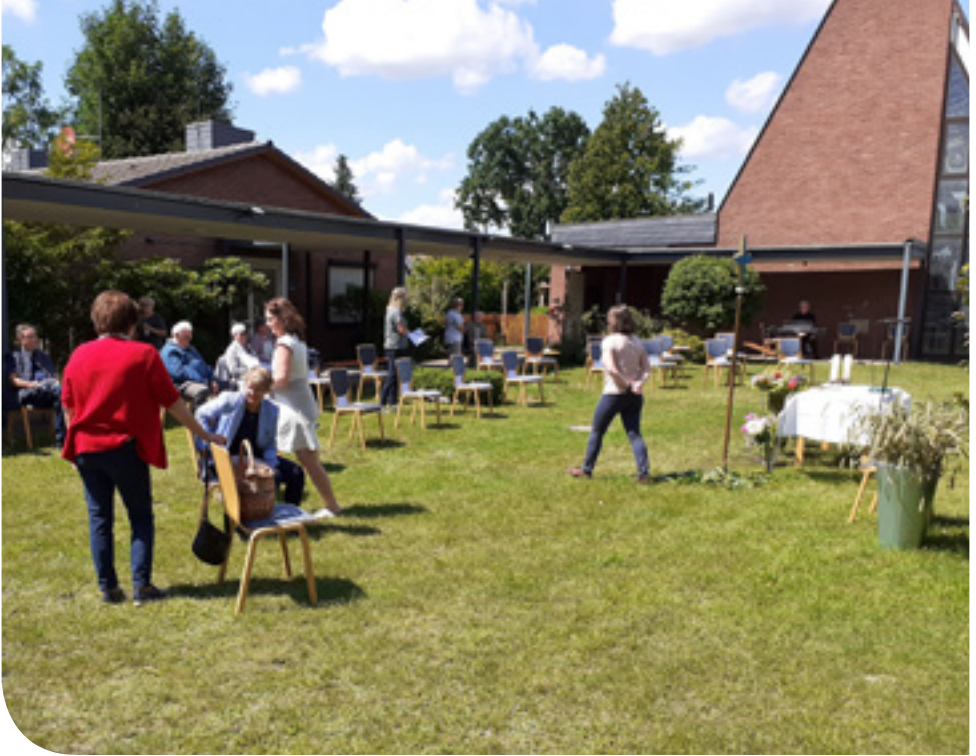
Vorbereitung auf den Gottesdienst