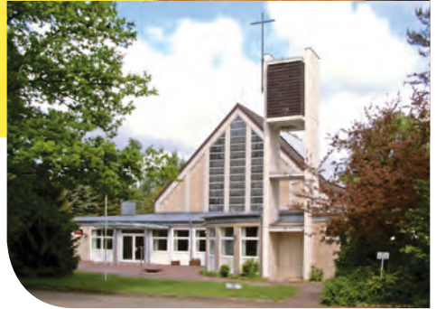
St. Johannes Kirche in Celle

in die richtige Reihenfolge gebracht werden mussten und Fragen dazu beantwortet werden mussten. Die Kinder haben haushoch gewonnen. Aber das Programm ging noch weiter. Denn kurz darauf kam ein Inspektor, der einen Mordfall aufklären und einen gefährlichen Mörder jagen musste, der zur Zeit in der Gegend sein Unwesen trieb. Dazu nahm er eine kleine Gruppe von Kindern mit, die ihm dabei helfen sollten. Und so starteten sie in die Nachtwanderung, die nach einem Weg voller Leichen damit endete, dass der Mörder gefasst werden konnte. Zufrieden und müde fielen dann schließlich alle ins Bett, um am nächsten Morgen wieder früh aufzustehen. Da ging es dann nämlich in die Kirche St. Johannes in Celle, in der es normalerweise nur drei Messdie-