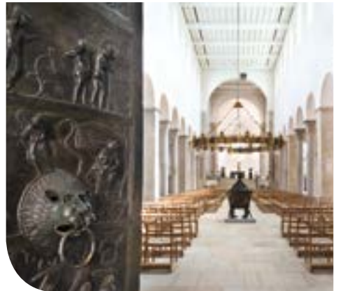
Bernwardtür des Hildesheimer Doms

Sehenswürdigkeiten hinterließen einen bleibenden Eindruck bei allen Teilnehmern.