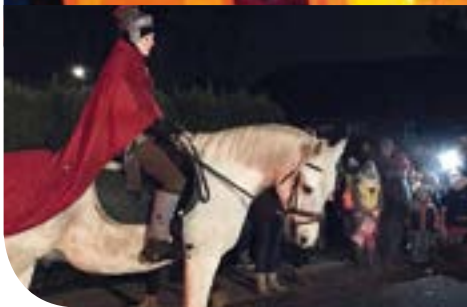
Martinsspiel und Laternenumzug in Schwarmstedt