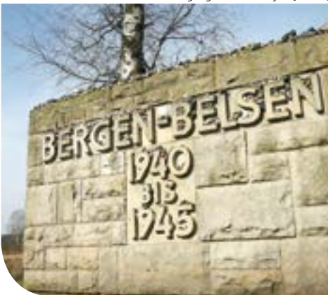
Stein am Eingang zum Friedhof

Urlaub vor der Haustüre lohnt sich, darum „Taste the Faith“, auch im Jahr 2019. Simon Müntefering